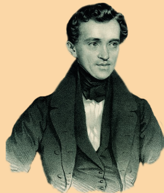
Johann Strauss (Vater)

Symposium – Konzerte – Round-Table Wiener Tanzmusik, die 2. Wiener Schule und ihr Umfeld