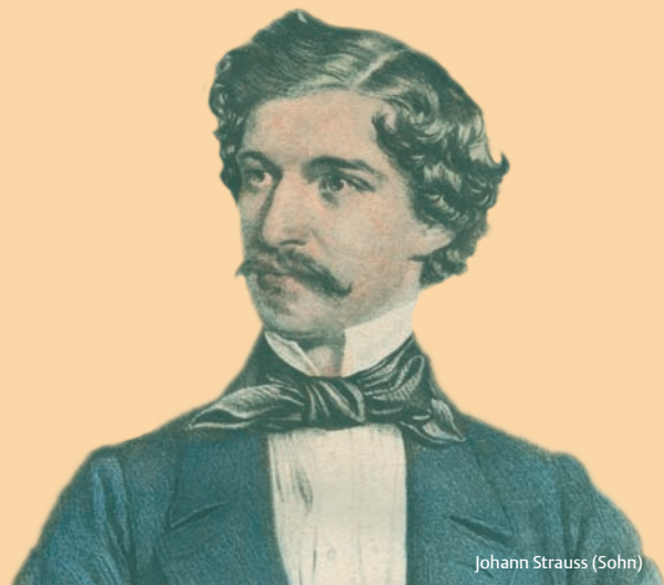
Johann Strauss (Sohn)

In Kooperation mit der Musiksammlung der Wienbibliothek im Rathaus Wien 1, Bartensteingasse 9 / 1. Stock