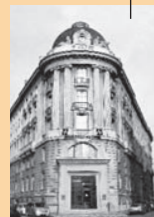
Arnold Schönberg Center Palais Fanto

Telefon (+43/1) 712 18 88 Fax (+43/1) 712 18 88-88 office@schoenberg.at