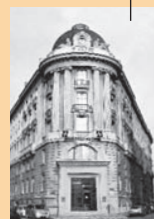
Arnold Schönberg Center Palais Fanto

Telefon (+43/1) 712 18 88 Fax (+43/1) 712 18 88-88 office@schoenberg.at